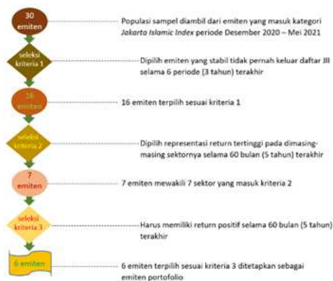
Gambar 1 Langkah-langkah penarikan sampel

Kegiatan penelitian ini dilakukan dari bulan Mei 2021 sampai dengan Agustus 2021. Populasi dalam penelitian merupakan saham yang tergabung dalam JII dikarenakan masa-masa pandemi Covid-19 cenderung semua saham merosot sedangkan saham-saham JII meningkat. Populasi adalah 30 saham yang masuk kriteria saham JII sesuai Lampiran Pengumuman BEI No. Peng-00355/BEI.POP/11-2020 tanggal 26 November 2020. Teknik sampling menggunakan purposive sampling . Purposive sampling adalah suatu teknik penentuan dan pengambilan sampel yang ditentukan oleh peneliti dengan pertimbangan tertentu (Sugiyono, 2015). Diambilnya emiten dengan return tertinggi di setiap sektor pada saham JII yaitu dengan tujuan mendapatkan portofolio dengan return yang optimum. Hasilnya 6 emiten sesuai kriteria. Kriteria sampel penelitian adalah: Stabil dalam Jakarta Islamic Index selama 6 periode (3 tahun terakhir), dipilih representasi return tertinggi di setiap sektornya dan sampel harus memiliki return positif selama 60 bulan (5 tahun terakhir).